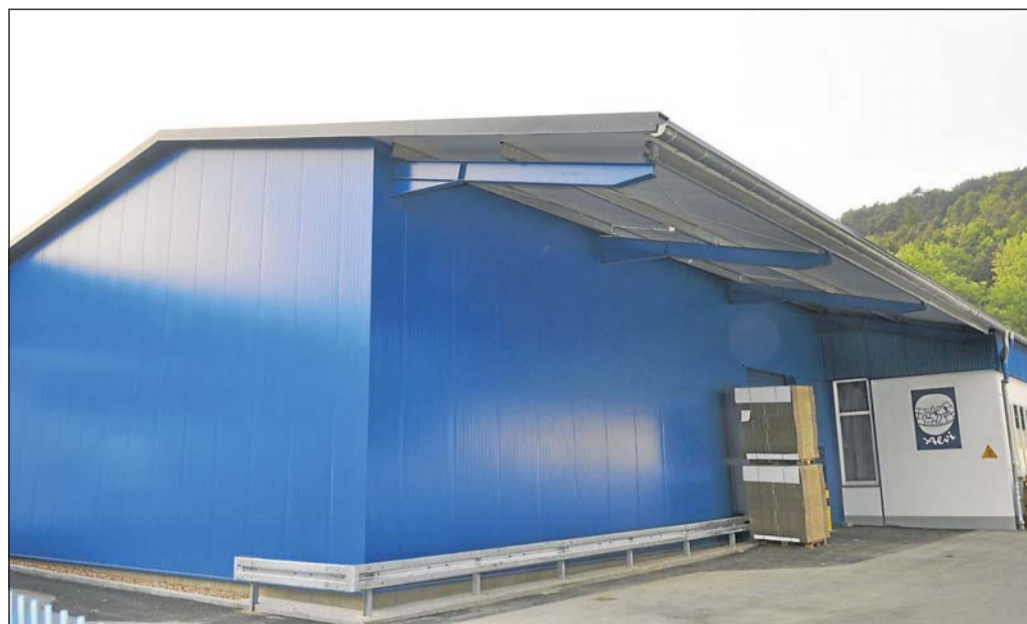
Die neue Halle ist auf dem Firmengelände in Höxter errichtet worden. Hier sind die Grenzen des Wachstums nun erreicht.

Das Unternehmen verwendet nach eigenen Angaben nur schadstofffreie Materialien, multifunktionale Gewebe und durchdachte Belüftungssysteme. Damit sollen optimale Voraussetzungen für den gesunden und sicheren Schlaf des Babys geschaffen werden, betont der Babyausstatter.